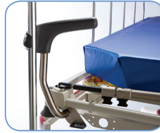
Entegre Serum Askılığı Taşıma Cihazı