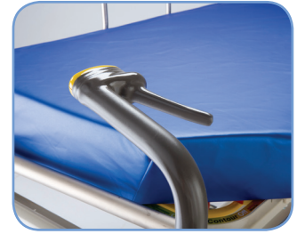
Aktif El Freni